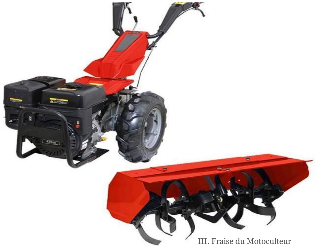
III. Fraise du Motoculteur