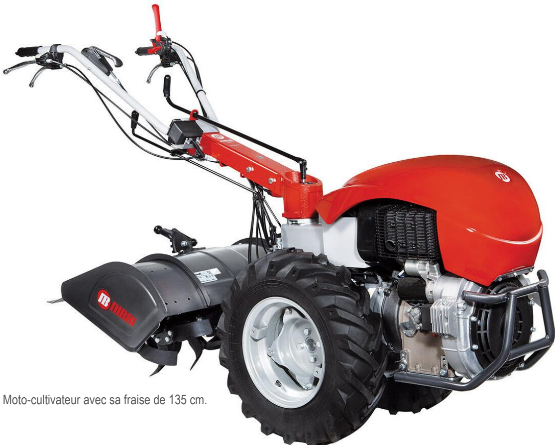
Motoculteur / Moto-cultivateur avec sa fraise de 135 cm.